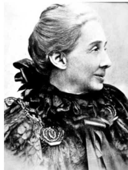
Amalia Domingo Soler La Luz del Porvenir 8 de Julio de 1897

¡Qué racional es la enseñanza del Espiritismo!... ¡bendita, bendita sea la hora que la voz de los invisibles resonó en mis oídos!... por ellos sí que podré leer en el libro de la ciencia y que con el transcurso de los siglos seré uno de los reformadores que agite la bandera del progreso universal.